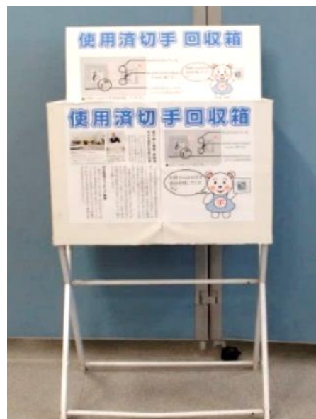
▲ボランティアルーム 前の切手回収ボックス

◎切手の四方に5mmから1cm余白がある ※封筒からはがさず余白を残してください