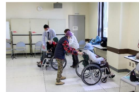
※昨年の講座の様子