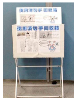
▲ボランティアルーム前の切手回収ボックス

使用済み切手は、封筒やハガキからはがさず、余白1cmを残して切り取った状態で、三郷市ボランティアセンターまでお持ちください。なお、郵送でも受け付けています。