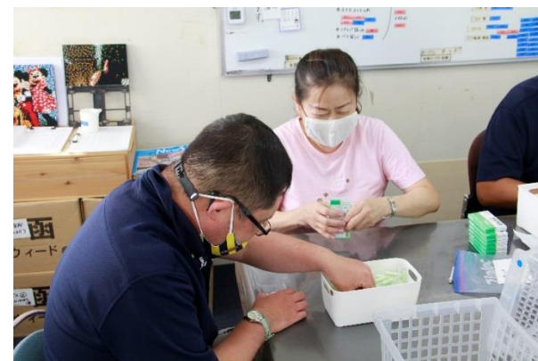
NPO法人コンパスの会

障がい者施設「NPO法人コンパスの会」と「NPO法人ひまわりの家」のボランティア体験プログラムを紹介します。どちらも、主に障がいのあるかたが通所し、仕事(作業)や活動を通して一人ひとりが自立した日常生活、または社会生活を営むことができるよう支援することを目的とした施設です。今回の体験プログラムでは、通所するかたと一緒に作業をしたり、江戸川の土手を散歩したりと1日一緒に過ごし交流しました。当事者のかた達は、参加者に積極的に話しかけ、「いつもと違う人がいて楽しかった。」と話していました。また、参加者も「みんなとても明るくて楽しく活動ができました。」との感想をいただきました。施設の皆さま、今年も受け入れをしていただきありがとうございました。