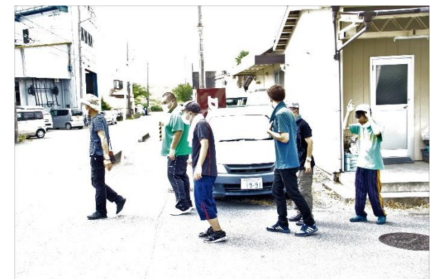
障害者の生活・作業施設「ひまわりの家」