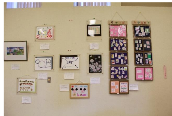
△いろいろな作品が展示されます