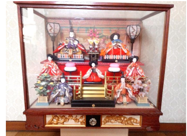
▲寄付いただけるひな飾り