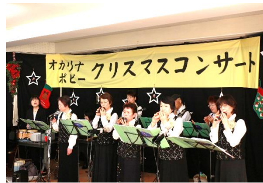
▲今年のクリスマスコンサート