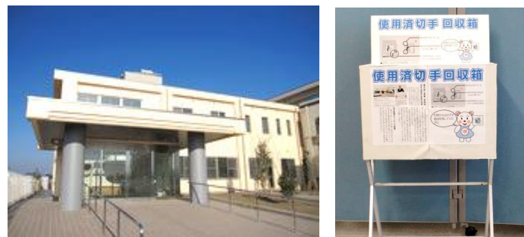
▲養護盲老人ホームひとみ園（深谷市人見 1665-3）