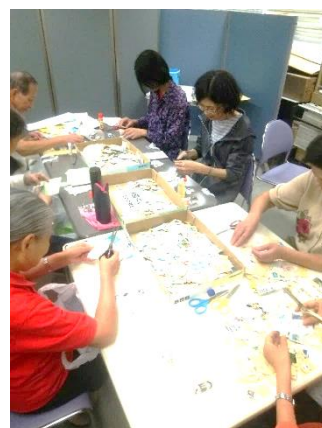
▲切手の仕分け活動の様子