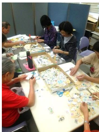
▲切手の仕分け活動の様子

毎月1~2回、午後1時30分から3時30分まで健康福祉会館5階ボランティアルームで、切手の仕分けをするボランティアを募集しています。初めてでも参加できますので、興味のあるかたは下記までお問い合わせください。