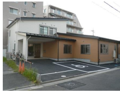
◀エレソルデイサービスセンター

通所介護施設「エレソルデイサービスセンター」では、利用者の余暇の時間がより楽しくなるよう、歌や楽器の演奏などで楽しませてくださるかたを募集します。