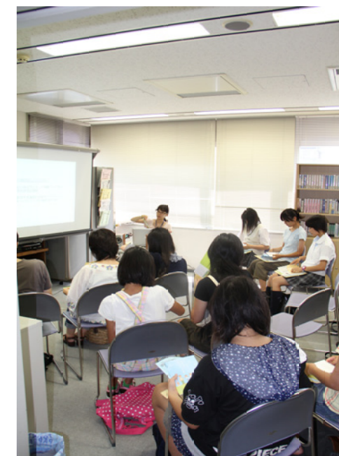
16日(土)の事前説明会の様子

7月11日～7月16日の6日間、これからボランティア活動を体験してみよう!と応募いただいた参加者のかたを対象に事前説明会を実施しました。今年120人を超す申込があり、会場が満員になることもありました。ボランティア活動のことや、参加するにあたって心がけてほしいことなどをスライドや資料、ビデオを使って説明しました。これから始まるボランティア体験に期待と不安を胸に、皆さん真剣に話を聞いていました。