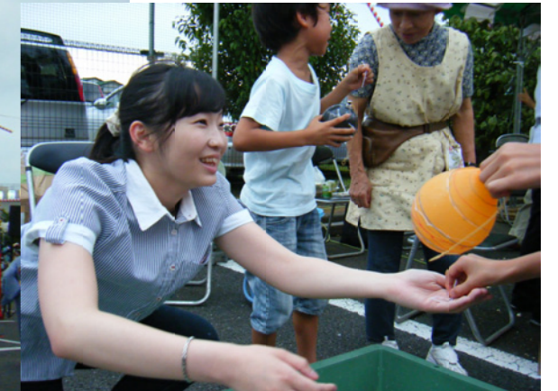
ヨーヨー釣りコーナーで接客中