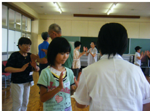
ロービジョン「愛夢の会」