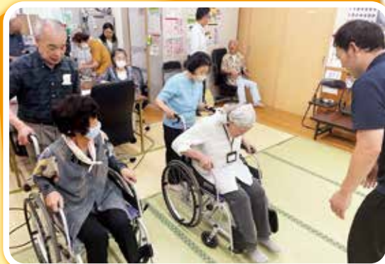
サロンでの出前講座の様子▲

福祉に関する情報等を地域にお届けする「ふくし出前講座」を実施しています。市民のかたの福祉への関心を高めることで、福祉活動への参加を促進します。