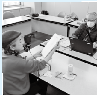
▲音訳ボランティアが広報紙を録音する様子

視覚障がい者の福祉増進を図ることを目的として、音訳ボランティアにご協力をいただき「社協だより」などの広報紙を音声情報にし、対象者へお届けしています。