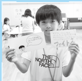
▲地域の高齢者にむけた「メッセージカードづくり」

誰もが気軽にボランティア活動に参加できるきっかけづくりのために、「彩の国ボランティア体験プログラム」を開催し、ボランティア活動の推進や支援を行っています。