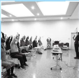
▲「仲間と楽しむ健康づくり」をテーマに講演

町会・自治会・管理組合や企業、団体など様々なかたに対し、福祉に関心を持ってもらうことを目的に、社協職員が出向いて講座を行います。