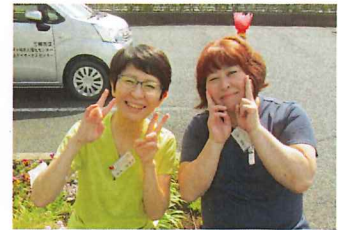
(左より)→ 幸内介護職員 山田介護職員