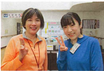
↑(左より) 浅野間所長 田嶋生活相談員