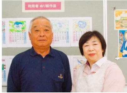
(左より) 恩田事務職員 小川事務職員