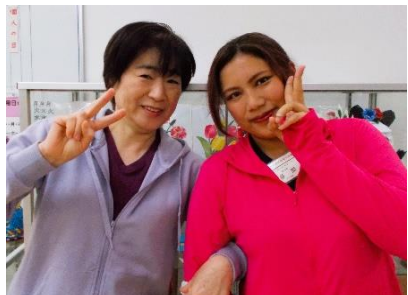
(左より) 戸田介護職員 昼間介護職員