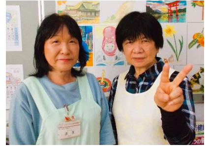
(左より) 道言事務職員 野瀬事務職員