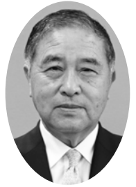
社会福祉法人 三郷市社会福祉協議会