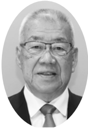
三郷市長 木津雅晟