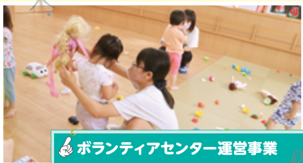
ボランティアセンター運営事業

ボランティアセンターでは、ボランティア活動を推進するため、さまざまな事業を行っています。その一つとして、夏休みにボランティア体験をする「彩の国ボランティア体験プログラム」を実施しています。写真は、中学生が保育所の子どもたちと交流している様子です。