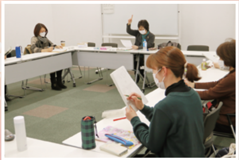
▲音訳ボランティアステップアップ講座を開催

社協では、社協だよりや市の広報などを音訳し、視覚に障がいのあるかたにお届けしています。音訳するために、ボランティアグループ「音訳ボランティアこだま」のみなさんや「音訳ボランティアステップアップ講座」に参加している方々に協力していただいています。