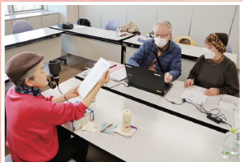
▲市内では多くのボランティアが活躍中！