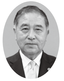
社会福祉法人 三郷市社会福祉協議会