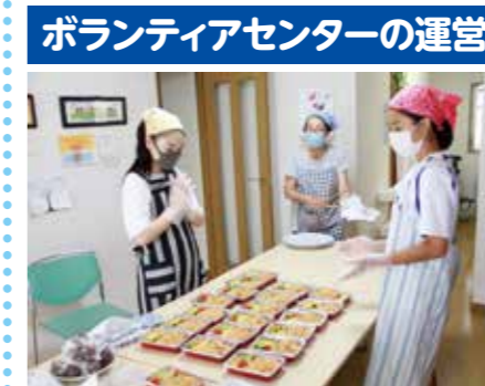
ボランティアセンターの運営