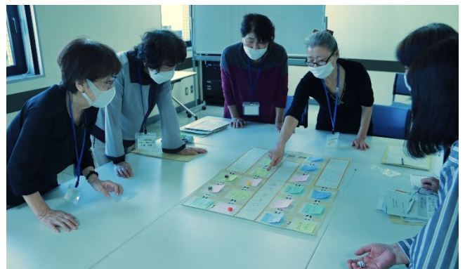
▲すごろくをしながら、みんなで情報交換

そのために取り組んでいることなどを付箋紙に書き込んでいきました。最後には、すごろく遊びを通じて、みなさんの活動の様子を情報交換しました。