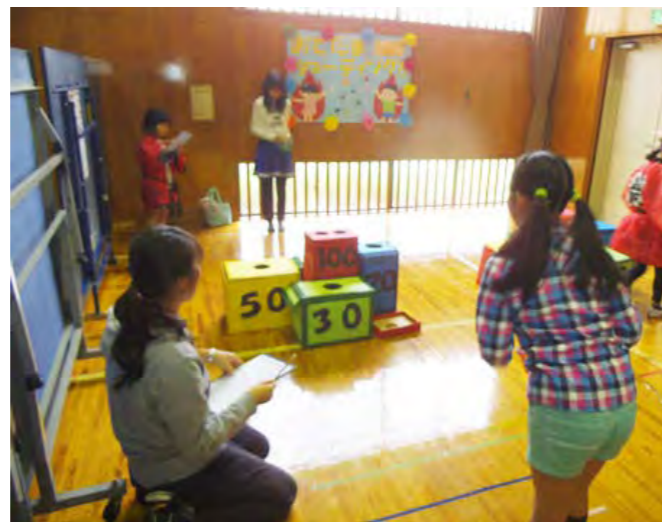
▲会場には楽しいゲームコーナーがいっぱい。

10月7日④までに電話、電子メールのいずれかで①氏名(ふりがな)、②性別、③年齢、④住所、⑤連絡先電話番号、⑥所属(学校名、勤務先など)をご連絡ください(午前9時~午後5時)。