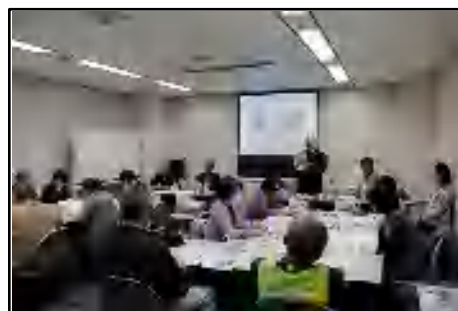
昨年の講座の様子。 老人クラブ、NPO法人、ボラン ティア活動者から事例発表して いただきました。

三郷市社会福祉協議会 地域福祉課 福祉推進係 〒341-0041 三郷市花和田638-1 三郷市健康福祉会館5階 【TEL】048-953-4191 【FAX】048-953-4192