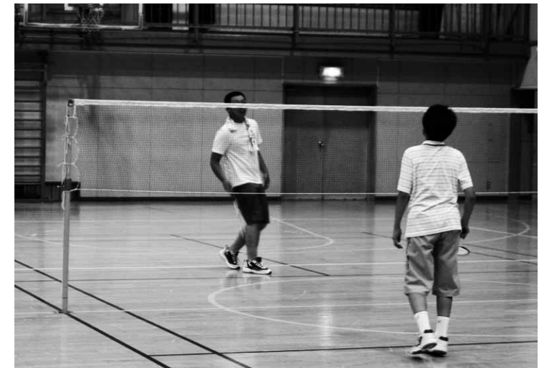
体験プログラムでの一コマ。